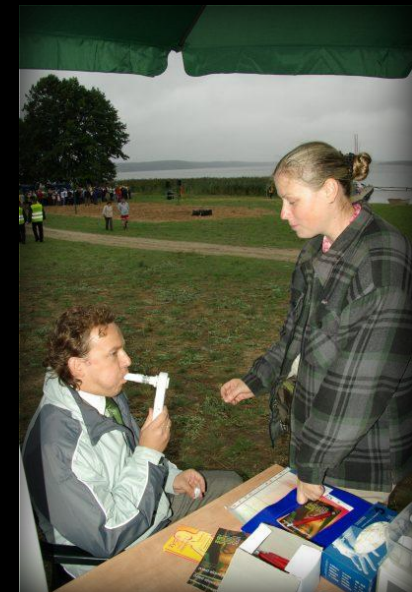
Badaniu poddał się także Wice Starosta Powiatu Chojnickiego.