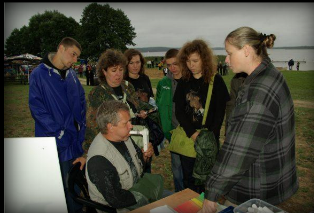
Czasem badanie odbywało się pod okiem całej rodziny ☺.