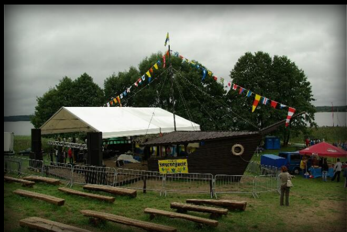
Estrada koncertowa stylizowana na statek.