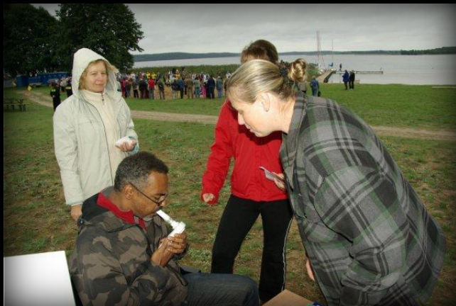
W badaniu uczestniczył także obcokrajowiec ☺.