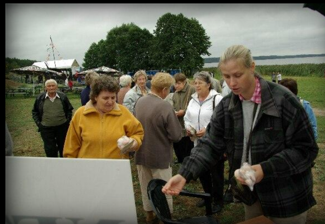
Panie bardzo chętnie brały ulotki informacyjne wraz z gadżetami pamiątkowymi