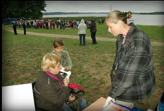
Chętnych do badania przybywało...