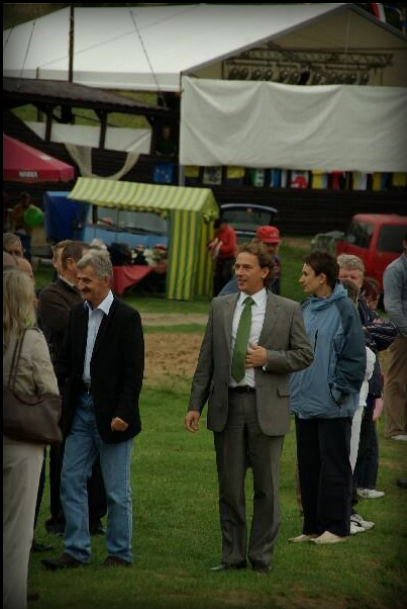
Wice Starosta Powiatu Chojnickiego.