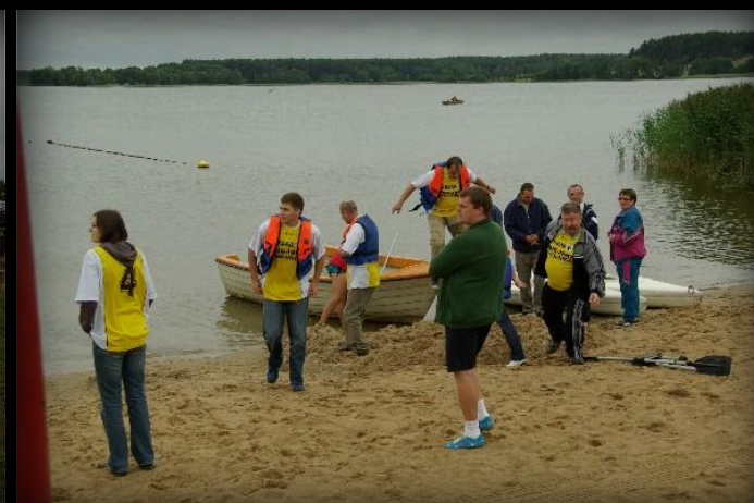
Zawodnicy tuż po wyjściu z łodzi na plażę po pierwszym wyścigu.