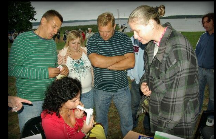
Pierwsza z Pań, która poddała się badaniu na poziom zawartości tlenku węgla w wydychanym powietrzu