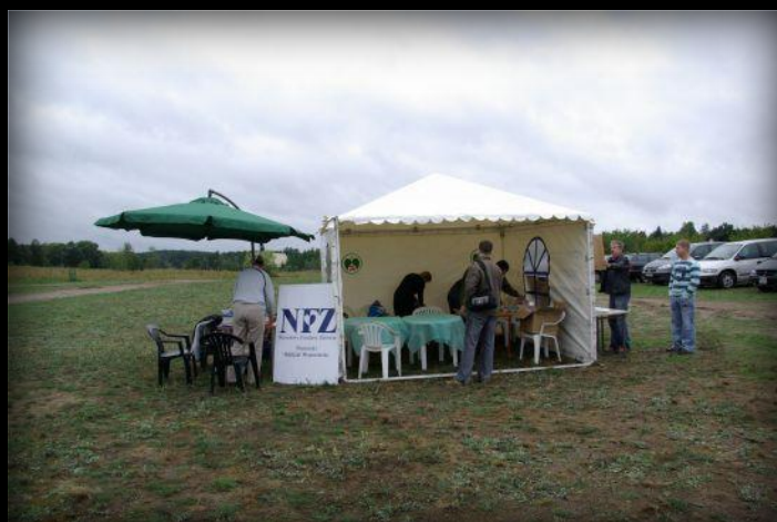
Nasze stoisko tuż przy namiocie rozstawionym przez przedstawicieli SP ZOZ w Chojnicach.