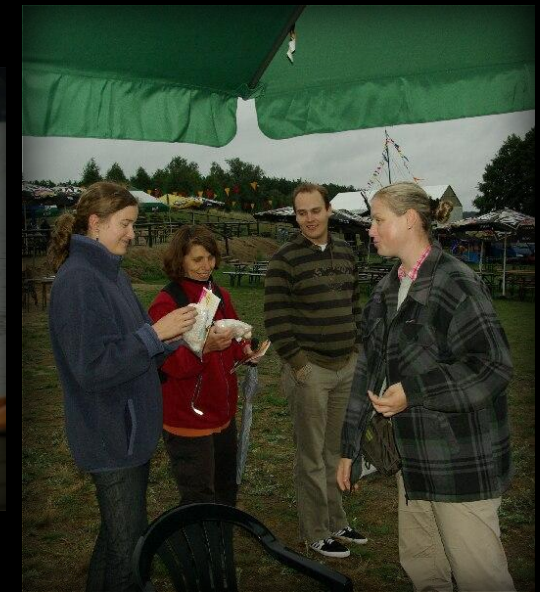
Jedni z pierwszych chętnych przy naszym stoisku, na razie po ulotki informacyjne ☺.