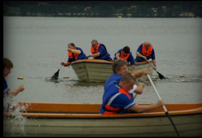
Zawodnicy dwu drużyn podczas zaciętej rywalizacji w wyścigach łodzi.