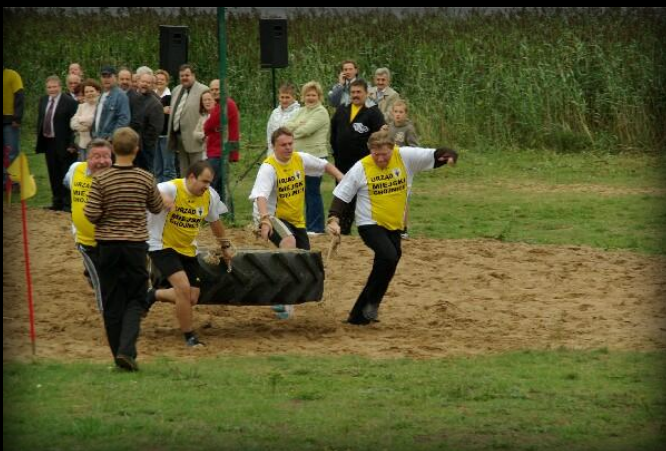
Rywalizacja miała miejsce także w innych dyscyplinach – jak tutaj – bieg z oponą od ciągnika ☺.