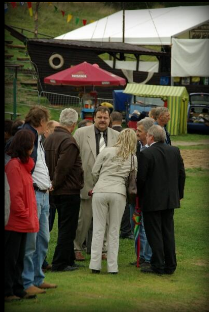
Starosta Powiatu Chojnickiego w otoczeniu gości.