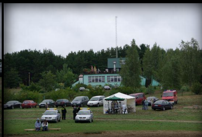
Widok na okolicę od strony plaży. Niebo podczas całego dnia było zachmurzone.